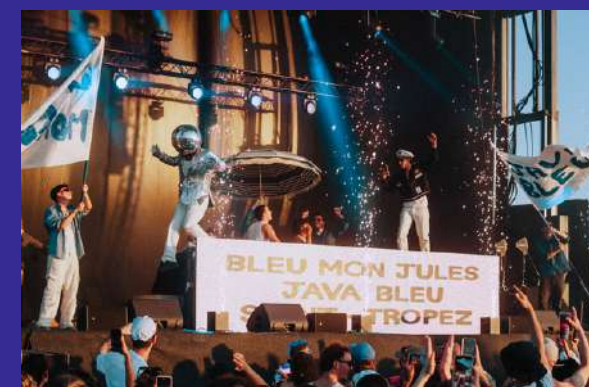
BLEU MON JULES